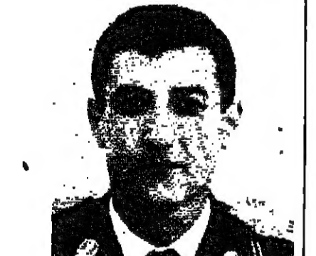
مجلسه مرور اربعين يوما على استشهاده

التي من المباراة المتوسطة السنوي. فوز ايطاليا على الولايات المتحدة ١/١.